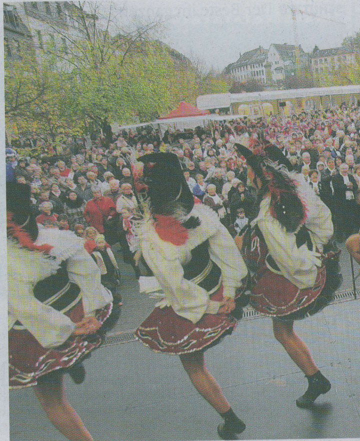
Mit einem tollen Bühnenprogramm begrüßen die Karnevals-